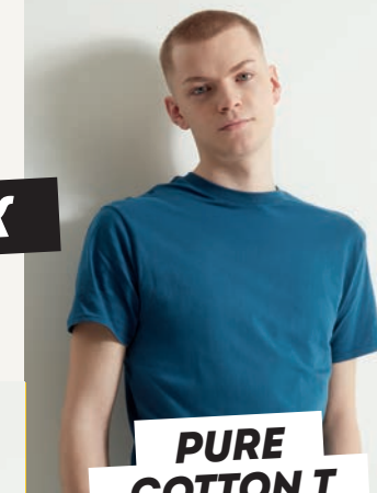
PURE COTTON T