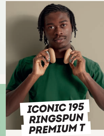
ICONIC 195 RINGSPUN PREMIUM T