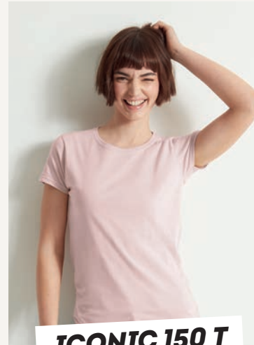
ICONIC 150 T