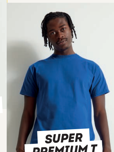
SUPER PREMIUM T