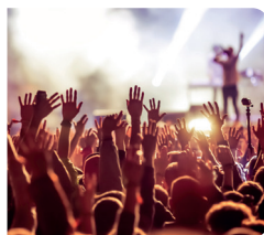
Konzerte, Events & Festivals