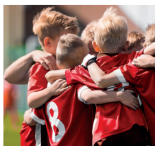
Vereine & Teams