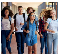
Schulen & Universitäten