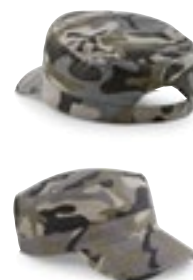
CB33 | B33 Camo Army Cap