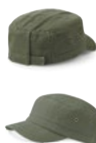
CB38 | B38 Urban Army Cap