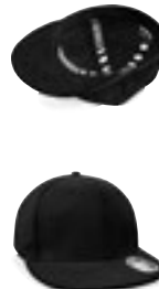
CB665 | B665 Pro-Stretch Flat Peak Cap

98% bomuld / 2% elasthan One Size (58 cm)