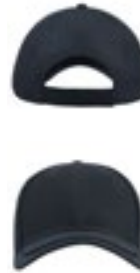
AT629 | GOLX Golf Cap

100% bomuld, Sweatbånd: 65% polyester / 35% bomuld