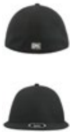
AT358 | SONE 100% polyester One Size