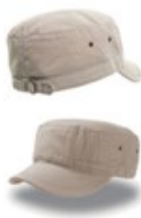
AT306 | URBA Urban Cap

100% bomuld S/M (57 cm), L/XL (59 cm) 250 g/m 2