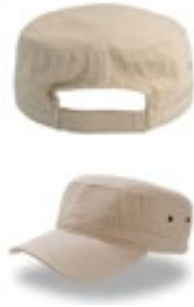
AT300 | ARCA Army Cap