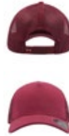
AT517 | RAJE Rapper Jersey Cap