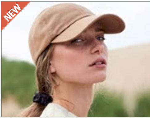
CB652N | B652N Organic Cotton 6 Panel Dad Cap