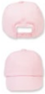
LW090 | LW090 Baby Cap

100% Baumwolle 6/12 Monate, 1/2, 3/5 Jahre 185 g/m 2