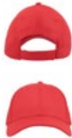
AT626 | SPAC Space Cap

100% Polyester, Schweißband: 65% Polyester / 35% Baumwolle