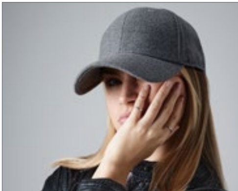
CB674 | B674 Melton Wool 6 Panel Cap

100% Chino-Baumwolle | Abreißetikett für einfaches Rebranding | Sechs-Segmente-Design mit niedrigem Profil | Weiche, unverstärkte Krone | Vorgebogenes Schild | Nahtumfasste Belüftungs-ösen | Eigenmaterial-Gurt mit Schiebeschnalle