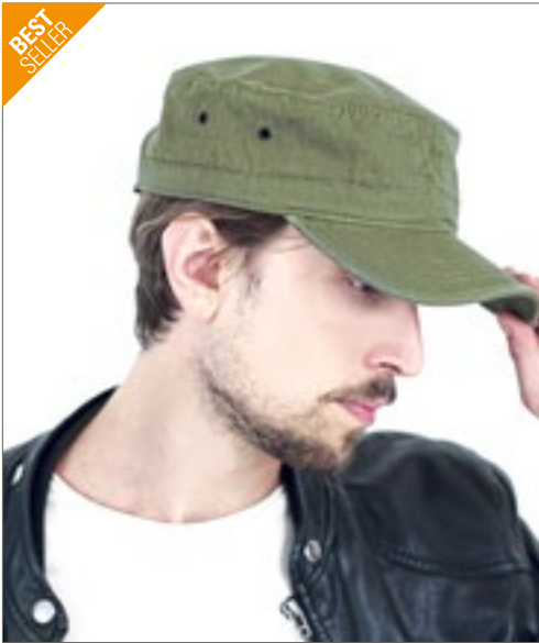
AT300 | ARCA Army Cap