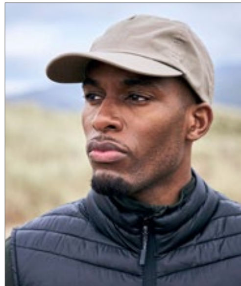
CEC004 | CEC004 Expert Kiwi Cap

65% Polyester / 35% Baumwolle One Size 160 g/m 2