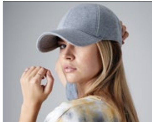
CB677 | B677 Jersey Athleisure Baseball Cap

Abreißetikett für einfaches Rebranding | Leicht gebogenes Sechs-Segmente-Design | Vorgebo-genes Schild | Schweißband und Innennaht-Bänder aus Baumwoll-Twill | Strukturierte Frontseg-mente | Gleichfarbiges Stoffband mit Rotguss-Metallschließe | Nahtumfasste Belüftungsösen