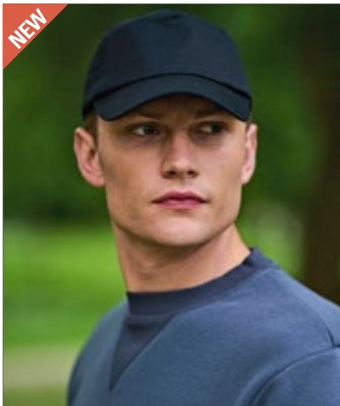
RG353 | TRC353 Pro 5-Panel Cap

5-Panel-Cap | Premiumqualität | Seitliche Mesh-Einsätze | Schwarze Schirmunterseite für besseren Sonnenblendschutz | Klettverschluss hinten | Funktions-Cap aus atmungsaktivem Obermaterial