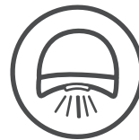
LED IM SCHIRM