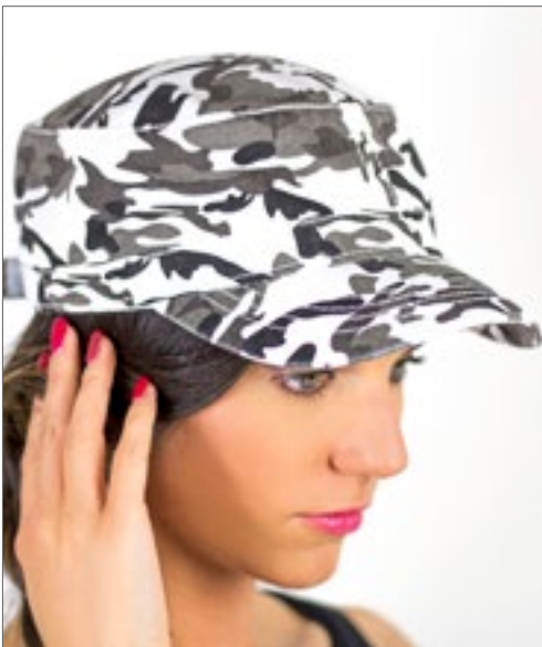
AT303 | UNIF Uniform Cap