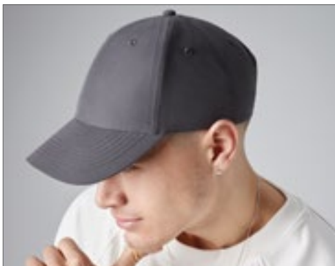
CB70 | B70R Recycled Pro-Style Cap

Baumwoll-Jersey | Schweißband und Innennaht-Bänder aus Baumwoll-Twill | Abreißetikett für einfaches Rebranding | Leicht gebogenes Sechs-Segmente-Design | Strukturierte Frontsegmente | Vorgebogenes Schild | Nahtumfasste Belüftungsösen | Eigenmaterial-Gurt mit Schiebeschnalle