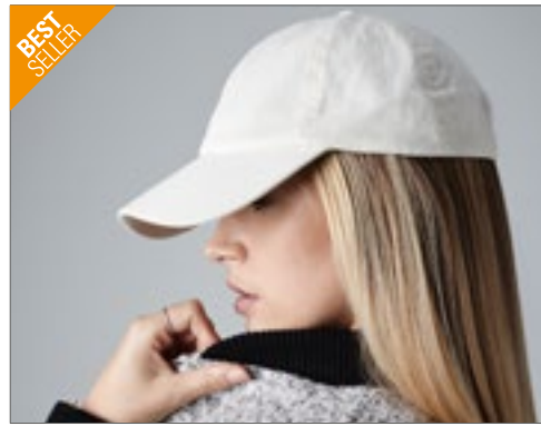
CB653 | B653 Low Profile 6 Panel Dad Cap

Kontrolliert biologisch angebaute Baumwolle | Sechs-Segmente-Design mit niedrigem Profil | Weiche, unverstärkte Krone | Vorgebogenes Schild | Verschlussband aus Hauptmaterial mit Steg-schnalle | Abreißetikett für einfaches Rebranding