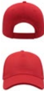
AT516 | GEAR Gear - Baseball Cap

Schirm + Front: 100% Polyester, Seiten + Rückseite: 100% Baumwolle One Size