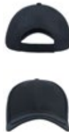
AT629 | GOLX Golf Cap

100% Baumwolle, Schweißband: 65% Polyester / 35% Baumwolle