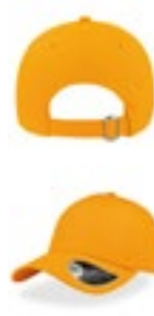
AT528 | SHOT Shot Cap