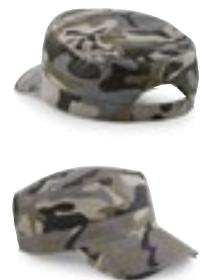
CB33 | B33 Camo Army Cap