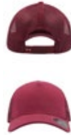
AT517 | RAJE Rapper Jersey Cap