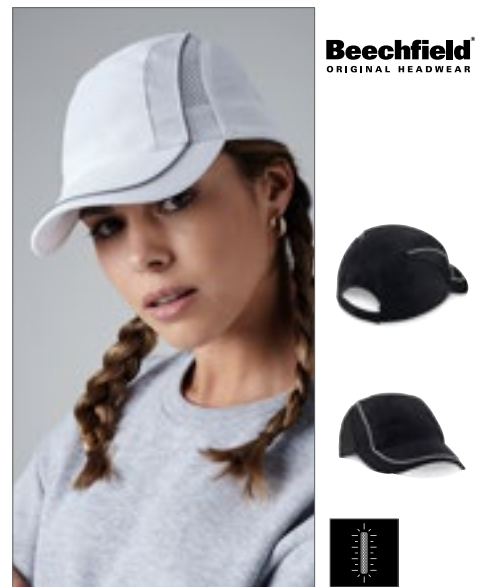
CB182 | B182 Coolmax® Flow Mesh Cap 100% Polyester One Size

Ripstop nylon / Kenmerken 100% polyester zweetband van Coolmax®-stof | Laag profielontwerp met 5 panelen | Waterdichte en ademende stof | Riemversteller met drukknopen | TearAway label voor gemak van rebranding