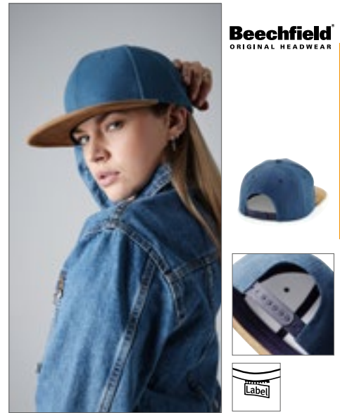
CB668 | B668 Suede Peak Snapback Pet: 100% Katoen, klep: 100% Polyester One Size

Kroon: 100% katoen canvas | 5-panelen design | Tear away label voor het gemak van rebranding | Platte klep | Faux suede piek | Leren riemversteller met gesp met messing effect | Authentiek metalen ventilatieoogje