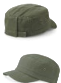
CB38 | B38 Urban Army Cap