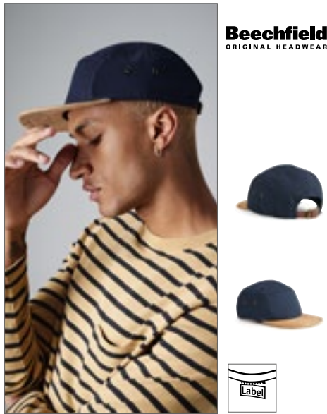
CB658 | B658 Suede Peak 5 Panel Cap Pet: 100% Katoen, klep: 100% Polyester One Size

100% katoenen keperstof | 5-panelen design | Gestikte ventilatieogen | Platte klep | Drukknopsluiting in retrostijl voor aanpassing van de maat | Camouflage detaillering | Tear away label voor het gemak van rebranding