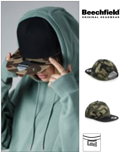
CB691 | B691 Camo Snapback 100% Katoen One Size