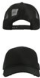
AT510 | RADS Rapper Destroyed Cap