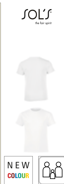
L149K | 01183 Kids' Round Collar T-Shirt Regent Fit

100% bavlna (Grey Melange: 85% bavlna / 15% viskóza), (Charcoal Melange, Heather Denim, Heather Oxblood, Heather Khaki: 60% bavlna / 40% polyester)