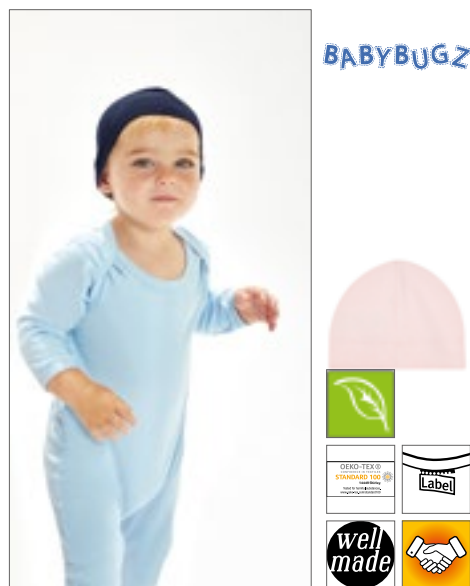
BZ62 | BZ62 Baby Hat

Organická bavlna nebo přechod na organickou bavlnu | Jemné, úzké pruhy barvené příze | Široký lem pro pohodlí | 2 uši | Měkká a pružná tkanina | Odtrhávací štítek