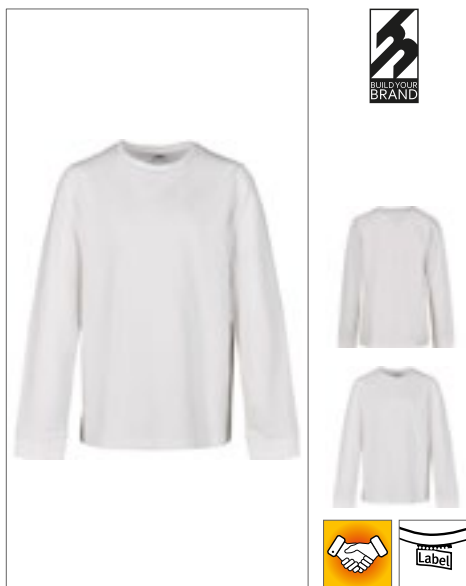
BY135 | BY135 Kids' Long Sleeve 100% bavlna 110/116, 122/128, 134/140, 146/152, 158/164 200 g/m 2 Build Your Brand

100% měkká bavlna | Sportovní dlouhý rukáv | Široký, volný střih | Široké manžety | Ke krku, přiléhavé | Jednoduchý žerzej