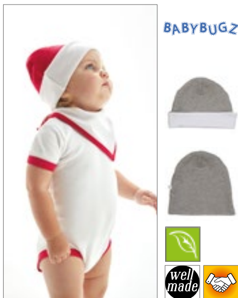
BZ44 | BZ44 Baby Reversible Slouch Hat

Organická bavlna, česaná kruhově dopřádána | Interlock | Široký uzel u otvoru | Dokončeno uzlem nahoře | Neutrální štítek s velikostí