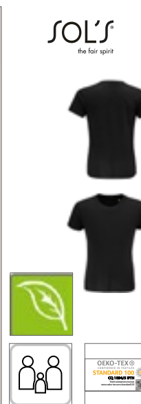
L03580 | 03580 Kids' Crusader T-Shirt