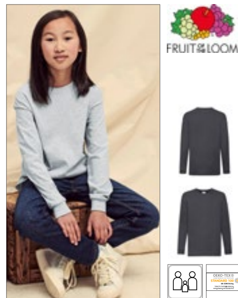
F240K | 61-007-0 Kids' Valueweight Long Sleeve T 100% bavlna (Heather Grey: 97% bavlna / 3% polyester), (Dark Grey Heather: 50% bavlna / 50% polyester) 104, 116, 128, 140, 152, 164 165 g/m 2 (White: 160 g/m 2 ) Fruit of the Loom

Měkký a pružný | Přiléhavé | Interlock | Lemovaný výstřih | Česaná bavlna