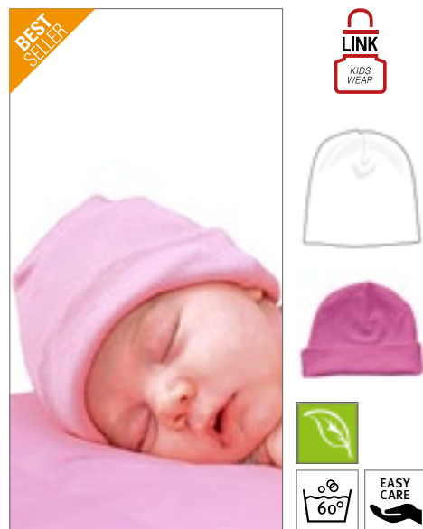
X944 | BBH10 Bio Baby Hat

Postranní švy | Vysoce kvalitní interlock | Bez potisku | Lze prát na 60 stupňů | Měkká a elastická interlocková tkanina | Organická česaná bavlna a sociální standardy, interlock