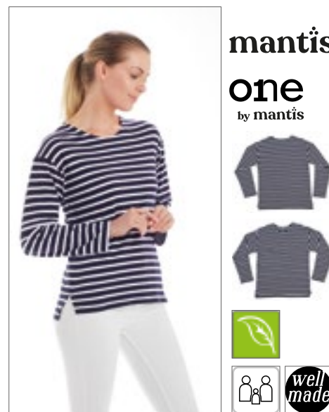
P136 | M136 Unisex One Breton Top 100% bavlna XS, S, M, L, XL, XXL 200 g/m 2 Mantis

Organická bavlna nebo přechod na organickou bavlnu | Proužky barvené příze 16 mm x 8 mm | Boční průduchy | Prodloužený zadní díl | Měkká a pružná tkanina | Postranní švy