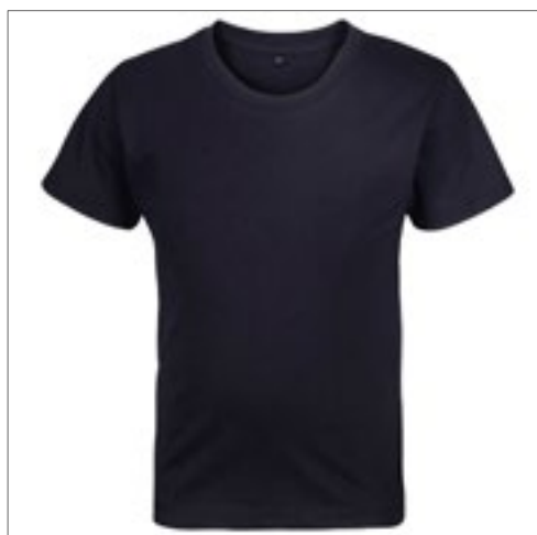
RTP03256 | 03256 Kids' Tempo T-Shirt 145 gsm (Pack of 10)

100% bavlna (Grey Melange: 85% bavlna / 15% viskóza) 4 (96/104), 6 (106/116), 8 (118/128), 10 (130/140), 12 (142/152) let 145 g/m 2 RTP Apparel