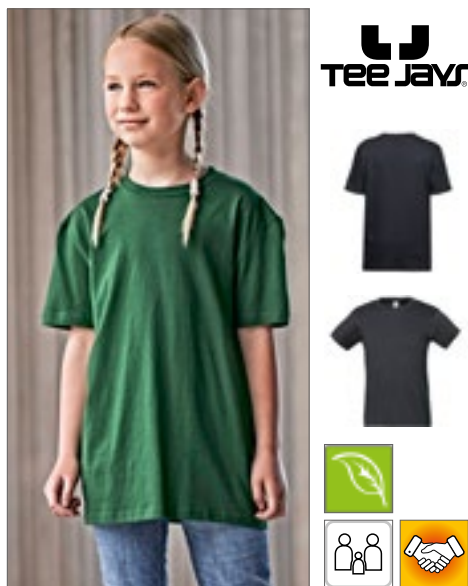
TJ1100B | 1100B Junior Power Tee

100% bavlna 4/6, 8/10, 12/14 let 140 g/m 2 Tee Jays