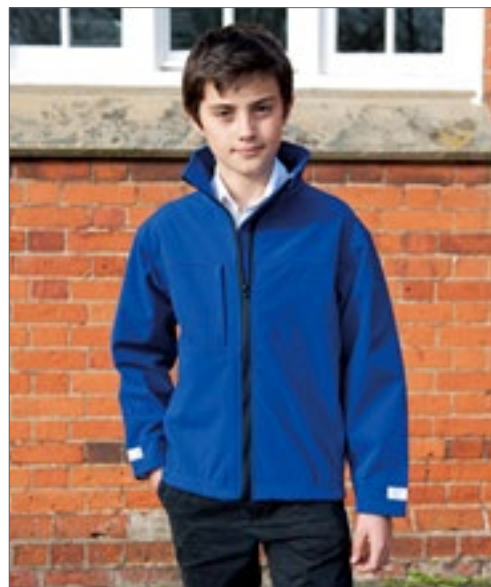
RT121Y | R121Y Youth Classic Soft Shell Jacket

320 g/m² 3vrstvý softshell | Vodotěsná (lepená tkanina) (8000 mm), prodyšná (1000 mvp) a větruodolná | Vnější vrstva: 93 % polyester, 7 % elastan | Střední vrstva:TPU prodyšná membrána | Vnitřní vrstva: mikroflis pro extra hřejivost | Módní tvarovaný prodloužený zadní díl | Měkká strečová tkanina a pohodlný aktivní střih | Zapínání na zip YKK vpředu po celé délce s vnitřní chlopní proti větru | 2 boční kapsy na zip | 1 náprsní kapsa na zip | 2 velké přední kapsy | 1 vnitřní kapsa na telefon (pouze 11–14 let) | Dekorativní sklad vpředu i vzadu | Přístupové body ke zdobení: středový vnitřní zip na rameni | Manžety s reflexním detailem