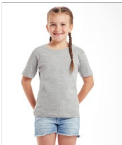
MK15 | HM15/MK15 Made in Africa Kids T

Česaná a kruhově dopřádaná bavlna | Postranní švy | Maloobchodní střih | Unisex velikosti