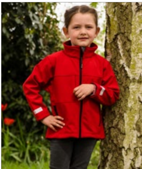
RT121J | R121J Junior Classic Soft Shell Jacket

100 % nylonový taft | Zip s jezdcem po celé délce | Kapuce skrytá v límci | Skládací bunda (systém K-Way) do kapsy s dvojitým posuvným zipem | Nastavitelný spodní lem se 2 poutky na suchý zip | B&C Collection je členem nadace Fair Wear Foundation