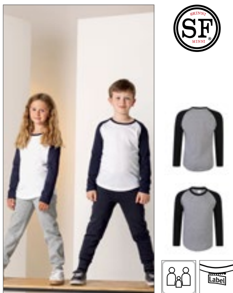
SM271 | SM271 Kids' Long Sleeved Baseball T 100% bavlna (Heather Grey: 85% bavlna / 15% viskóza) 5/6 (116), 7/8 (128), 9/10 (140), 11/12 (152) let 140 g/m 2 SF Minni

Kulatý výstřih s bavlněným/Lycra® žebrovaním | Zpevňovací páska za krkem | Žebrovaná manžeta z bavlny / materiálu Lycra® | Jemný úplet pro lepší potisk