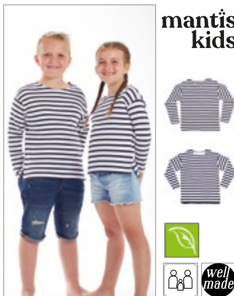
MK84 | HM84/MK84 Kids' Breton T 100% bavlna 2/3, 4/5, 6/7, 8/9, 10/12, 12+ let 200 g/m 2 Mantis Kids

Odtrhávací štítek SF (Skinsniff) | Kontrastní raglánový rukáv a žebrovaný výstřih se zpevňovací páskou za krkem | Prodloužený střih s tvarovanými bočními švy | Dvojitě prošitý zaoblený lem | Unisex