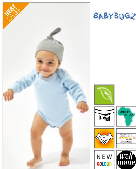
BZ15 | BZ15 Baby One Knot Hat

100% bavlna (Heather Grey Melange: 85% bavlna / 15% polyester)