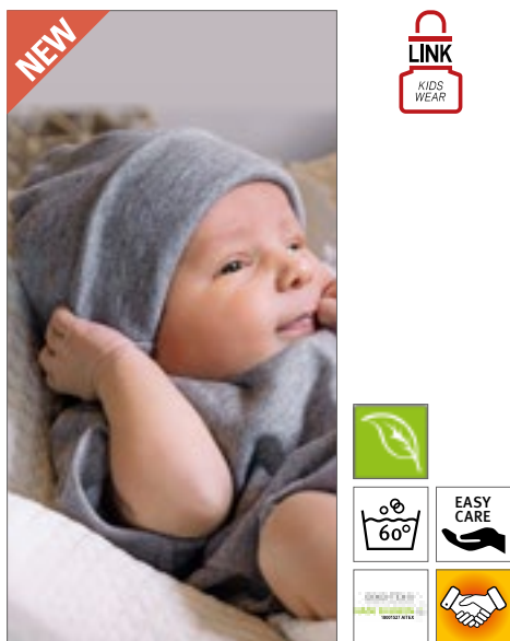
X10001 | 10001 Organic Baby Hat Rox 01

Organická bavlna nebo přechod na organickou bavlnu, česaná kruhově dopřádána | Interlock | Pohodlný široký pásek | Odtrhávací štítek s velikostí | Štítek s QR kódem pro sledování dodavatelského řetězce a kontrolu pozitivního dopadu nákupu organického materiálu | Štítek o údržbě vyrobený z organické bavlny