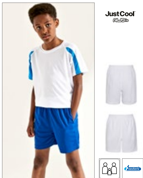
JC080J | JC080J Kids' Cool Short

100% Polyester 3/4 (XS), 5/6 (S), 7/8 (M), 9/11 (L), 12/13 (XL) jaar 140 g/m 2 Just Cool