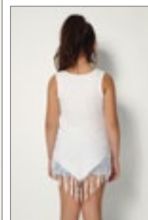
NH600 | POCAHONTAS Kids' Vest Pocahontas