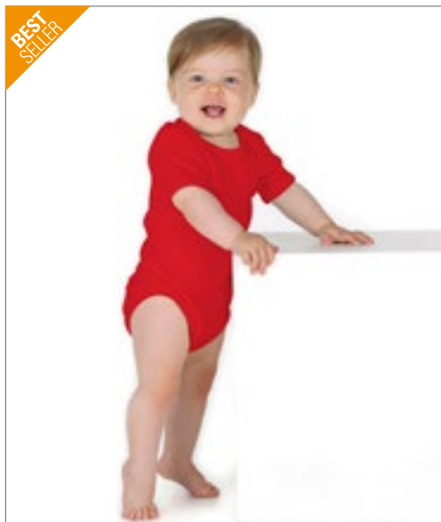
X946 | ROM40 Bio Bodysuit Short Sleeve