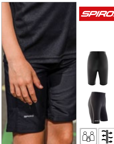
RT250J | S250J Junior Base Bodyfit Shorts

Elastiek in de taille | Mini mesh gevoerd binnenin | AWDiS' eigen lichtgewicht Neoteric ™ textuurweefsel met goede vochtafvoering | Zijzakken | Binnenzak voor munten | Eenvoudig afscheurlabel maakt het perfect voor rebranding