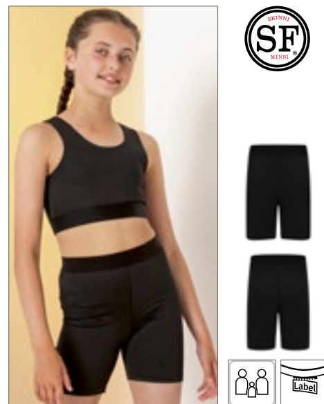
SM427 | SM427 Kids' Fashion Cycling Shorts

Elastische tailleband | Flat lock steek zijnaden | Contour fit panelen met contraststiksels | Reflecterend SPIRO-printlogo | Binnenzak met sleutel