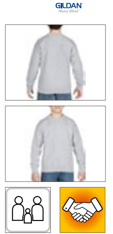
G18000K | 18000B Heavy Blend™ Youth Crewneck Sweatshirt