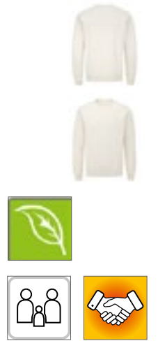
P05 | M05 Essential Sweatshirt