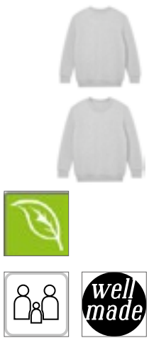
MK05 | MK05 Kids' Essential Sweatshirt