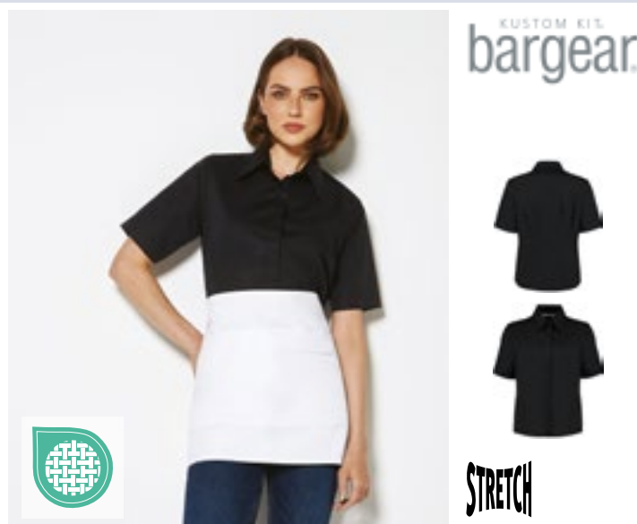
K735 | KK735 Women's Tailored Fit Shirt Short Sleeve

Měkký podlepený límec | Strečová látka pro větší pohodlí | Košilový lem | Náhradní knoflík