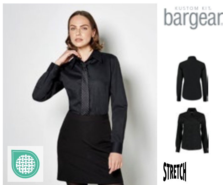
K738 | KK738 Women's Tailored Fit Shirt Long Sleeve

Měkký podlepený límec | Nastavitelné manžety | Strečová látka pro větší pohodlí | Náhradní knoflík | Košilový lem