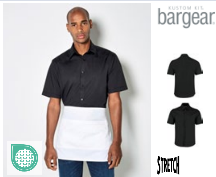
K120 | KK120 Men's Tailored Fit Shirt Short Sleeve