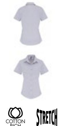
PW346 | PR346 Women's Stretch Fit Poplin Short Sleeve Cotton Shirt

97% bavlna / 3% elastan XS, S, M, L, XL, XXL, 3XL 115 g/m 2