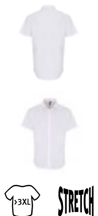
PW246 | PR246 Men's Stretch Fit Poplin Short Sleeve Cotton Shirt

97% bavlna / 3% elastan XS, S, M, L, XL, XXL, 3XL, 4XL 115 g/m 2