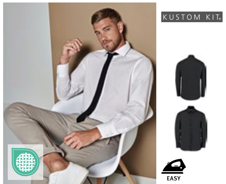
K131 | KK131 Men's Tailored Fit Business Poplin Shirt Long Sleeve

Figursyet snit | Matchende opretstående krave med knap | Matchende manchetter med 2 knapper og spids manchetsolpe | Stolpelukning med 7 integrerede knapper | Dobbeltsyede ærmegab og sidesømme | Justerbare manchetter | Dobbeltstikning på det lige bærestykke bagpå | Ekstra knapper på vaskelabel | Superwash® 60° | Kustom Kit® vævet nakkelabel