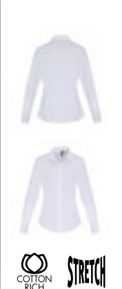
PW344 | PR344 Women's Stretch Fit Poplin Long Sleeve Cotton Shirt

97% Baumwolle / 3% Elasthan XS, S, M, L, XL, XXL, 3XL 115 g/m²