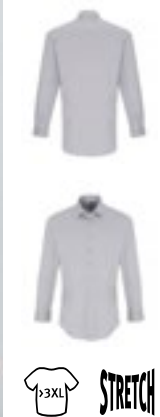
PW244 | PR244 Men's Stretch Fit Poplin Long Sleeve Cotton Shirt

97% Baumwolle / 3% Elasthan XS, S, M, L, XL, XXL, 3XL, 4XL 115 g/m²