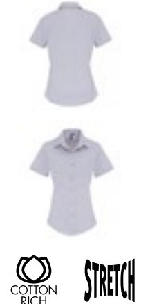
PW346 | PR346 Women's Stretch Fit Poplin Short Sleeve Cotton Shirt

97% Baumwolle / 3% Elasthan XS, S, M, L, XL, XXL, 3XL 115 g/m²