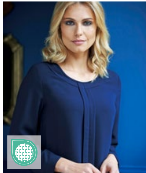
BR802 | 2279 Women's Roma Long Sleeve Blouse