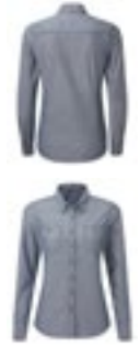
PW347 | PR347 Women's Organic Chambray Fairtrade Long Sleeve Shirt

100% coton XS, S, M, L, XL, XXL, 3XL 160 g/m²