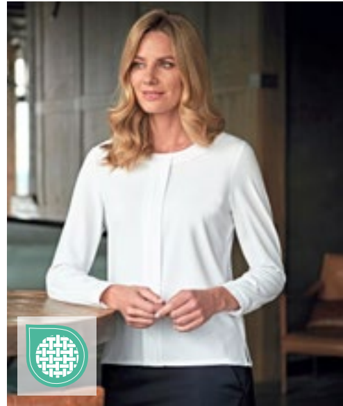
BR800 | 2264 Women's Riola Long Sleeve Blouse