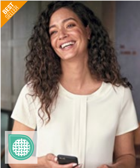
BR801 | 2265 Women's Felina Short Sleeve Blouse