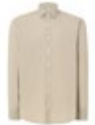
JHK200 | SHATULUM Camisa Tulum Shirt