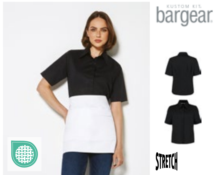
K735 | KK735 Women's Tailored Fit Shirt Short Sleeve

Kraag van zacht materiaal | Rekbaar stof voor comfort | Verlengd achterpand | Reserve knoop