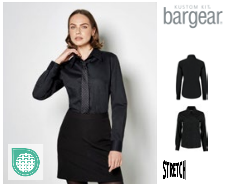
K738 | KK738 Women's Tailored Fit Shirt Long Sleeve

Kraag van zacht materiaal | Verstelbare manchetten | Rekbaar stof voor comfort | Reserve knoop | Verlengd achterpand