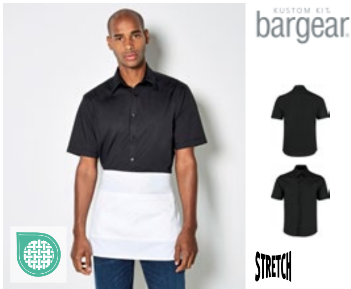
K120 | KK120 Men's Tailored Fit Shirt Short Sleeve

57% Katoen / 40% Polyester / 3% Elastaan 37 (S/14H), 38/40 (M/15-15H), 41/42 (L/16-16H), 43/44 (XL/17-17H), 45/47 (XXL/18-18H) 120 g/m 2