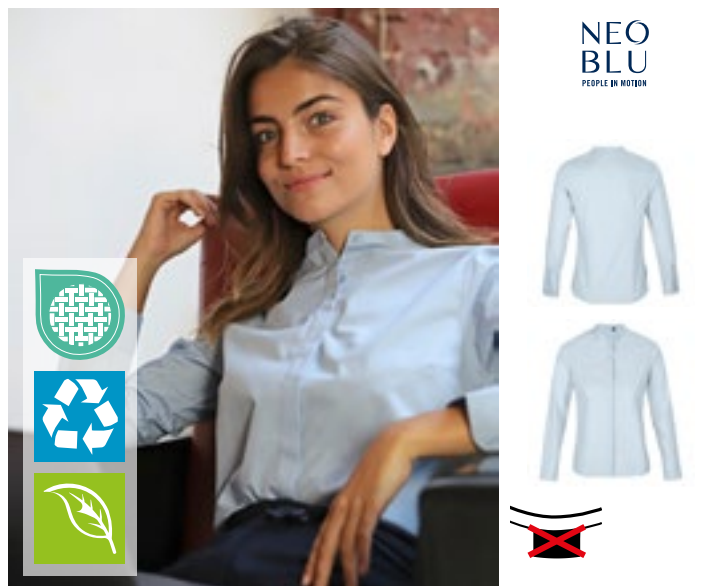
NB3787 | 03787 Women's Mao Collar Shirt Bart

Ekologisk bomull/återvunnen polyester | Poplin 120 | Justerat snitt | Kinesisk Mao-krage | Långa ärmar | Dold knappslå | Reglerbara muddar | Ingen etikett