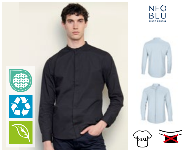
NB3792 | 03792 Men's Mao Collar Shirt Bart

60 % bomull/40 % polyester S, M, L, XL, XXL, 3XL, 4XL, 5XL